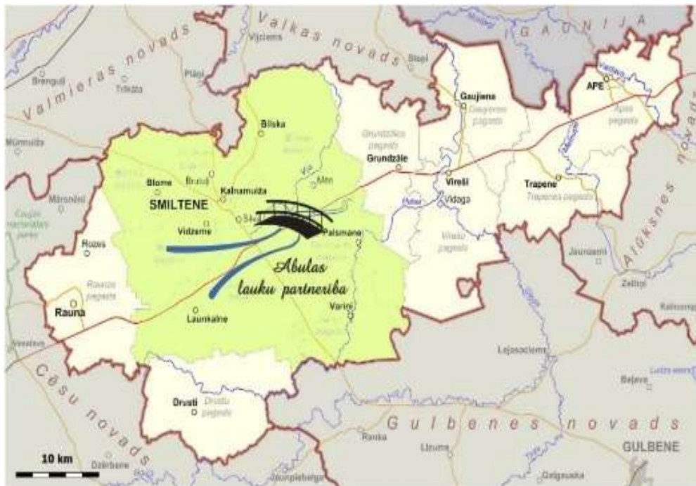
2. attēls. Abulas LP darbības teritorija Smiltenes novadā